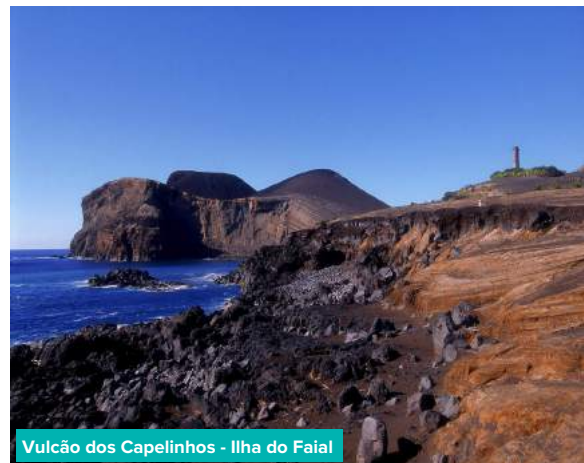
Vulcão dos Capelinhos - Ilha do Faial

Após o pequeno almoço buffet, saída para excursão pela Fajã de Baixo (terra natal de Natália Correia) para uma visita às tradicionais estufas de ananases, cultura biológica desenvolvida em estufas de vidro, com prova de licor . Continuação para o maciço montanhoso das Sete Cidades . Paragem nos miradouros do Pico do Carvão , local privilegiado para se observar a formosa paisagem verdejante da zona mais estreita da Ilha e das suas costas e Vista do Rei , onde se deslumbra a vista da cratera das Sete Cidades e das suas lindíssimas lagoas Azul e Verde. Inicia-se a descida para o interior da cratera, onde se irá maravilhar com a lagoa de Santiago , paragem que antecede a chegada à pitoresca freguesia das Sete Cidades . Almoço . No regresso pela costa Sul da Ilha, paragem no Miradouro do Escalvado (vista do extremo ocidental da ilha, das freguesias dos Mosteiros e a Plataforma Vulcânica da Ferraria). A excursão termina no aeroporto. Formalidades e partida às 18h00 em avião com destino a LISBOA .