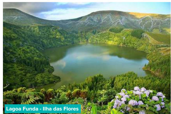
Lagoa Funda - Ilha das Flores