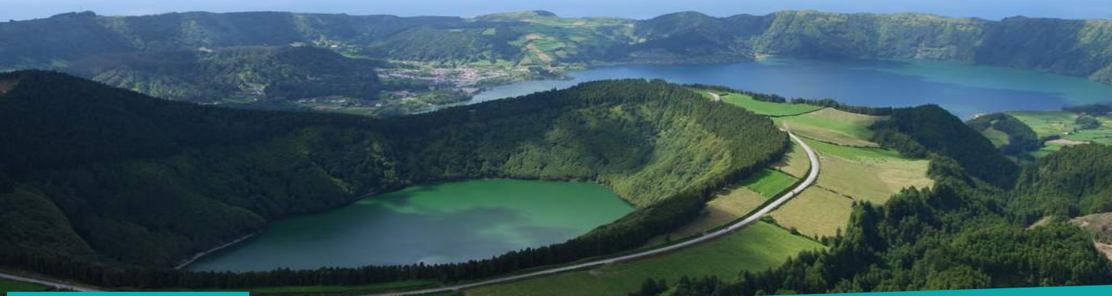
Lagoa de Santiago - Ilha de São Miguel

6 ILHAS | 8 DIAS | CIRCUITO TUDO INCLUÍDO