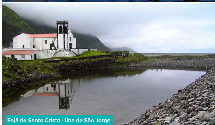
Fajã de Santo Cristo - Ilha de São Jorge

Após o pequeno almoço, embarque no ferry com destino à ILHA DE SÃO JORGE . Chegada, desembarque, seguido de excursão de visita à Ilha das Fajãs (manifestações únicas da natureza vulcânica dos Açores) pela Vila das Velas , Uzelina (admiremos a sua Torre sobrevivente à erupção vulcânica de 1808 e porto da laranja), Ribeira do Nabo (centro artesanal da ilha), Manadas, Vila da Calheta . Miradouro sobre impressionante falésias e as Fajãs de Santo Cristo e dos Cubres . Durante o percurso, terá lugar o almoço , bem como a visita a uma fábrica do conhecido queijo de São Jorge . Visita ao Parque Florestal das Sete Pontes , chegados à Vila das Velas , passeio a pé de visita ao jardim Público e Igreja Matriz de São Jorge . Jantar local. Depois o regresso no ferry ao hotel no Faial. Alojamento.