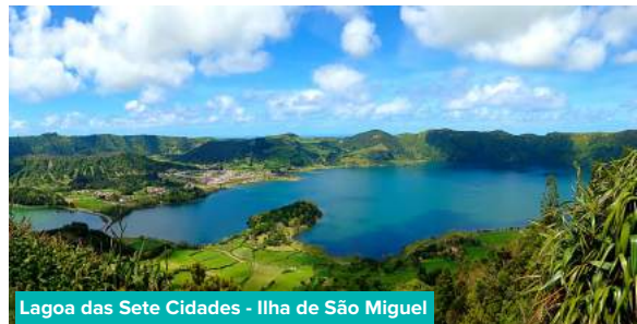
Lagoa das Sete Cidades - Ilha de São Miguel